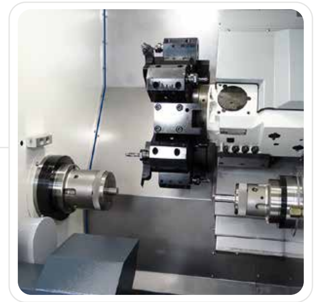
Interior de la máquina